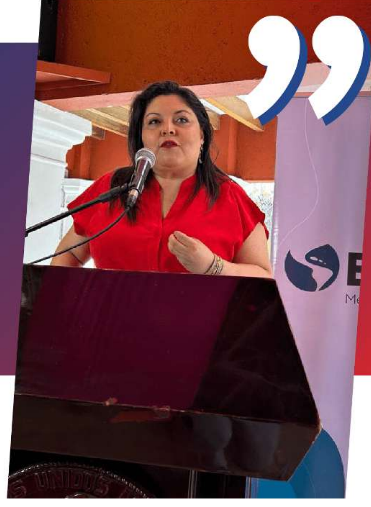
Cindy Quesada Hernández Ministra de la Condición de la Mujer

Fomentar la autonomía económica es esencial para que las mujeres logren plenamente sus derechos, superando ciclos de violencia y pobreza. La participación del sector privado es crucial en esta búsqueda de igualdad, respaldada por la institucionalidad. Destaco la relevancia de reactivar la comisión de alto nivel para implementar la IPG, la cual coordino personalmente, asegurando así acciones alineadas con los objetivos de la Ruta de género y la reducción de las brechas entre mujeres y hombres.